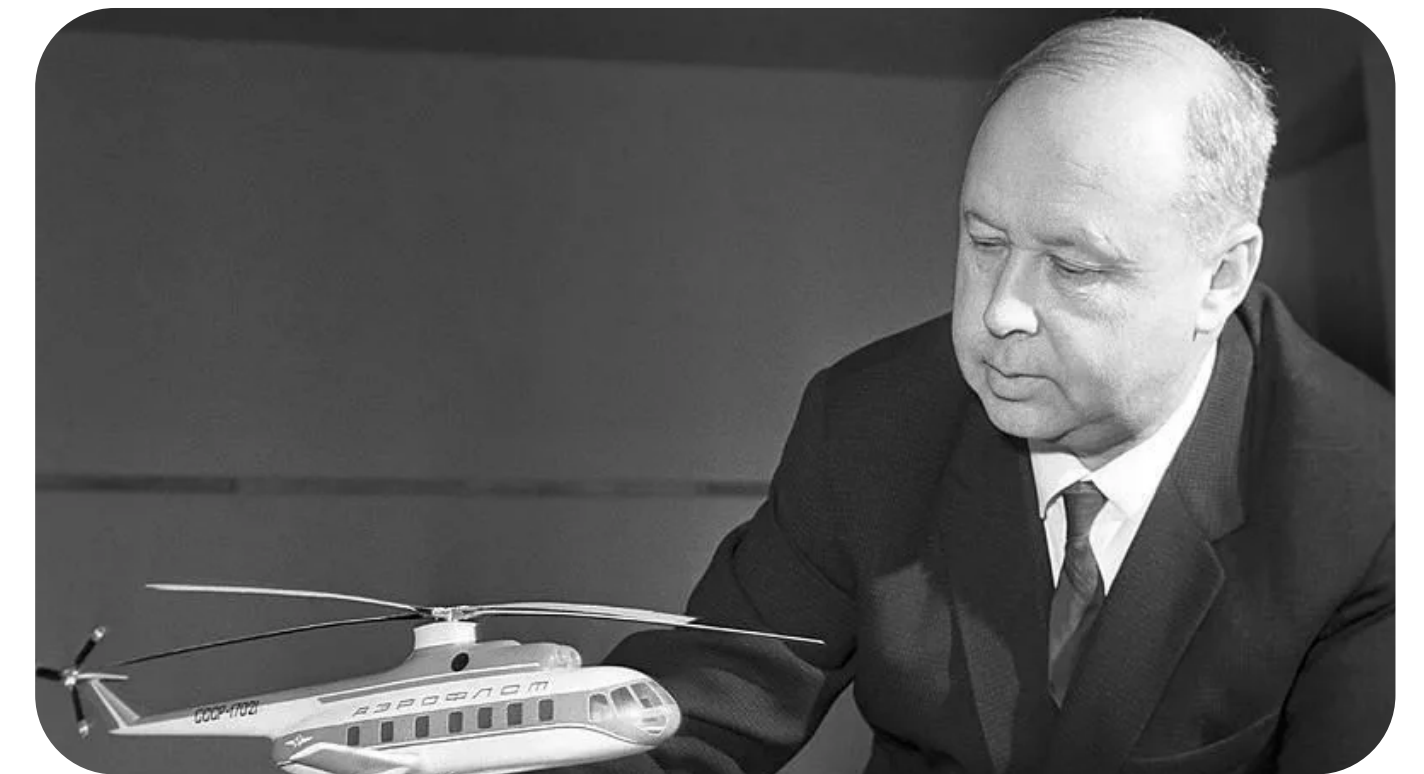
Михаил Леонтьевич Миль — советский конструктор вертолётов и учёный, доктор технических наук