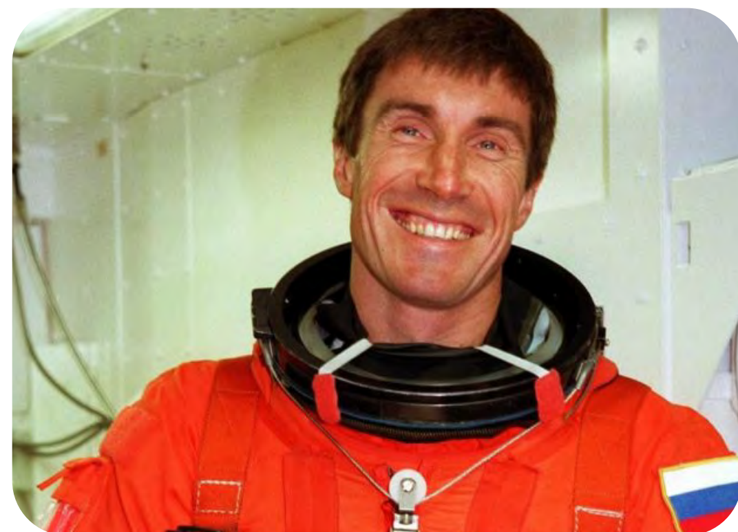
Сергей Константинович Крикалёв — советский и российский авиационный спортсмен и космонавт, лётчик-космонавт СССР, обладатель рекорда по суммарному времени пребывания в космосе (803 дня за шесть стартов)