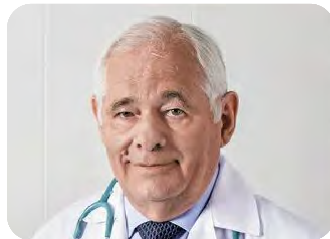
Леонид Михайлович Рошаль — советский и российский хирург, общественный деятель