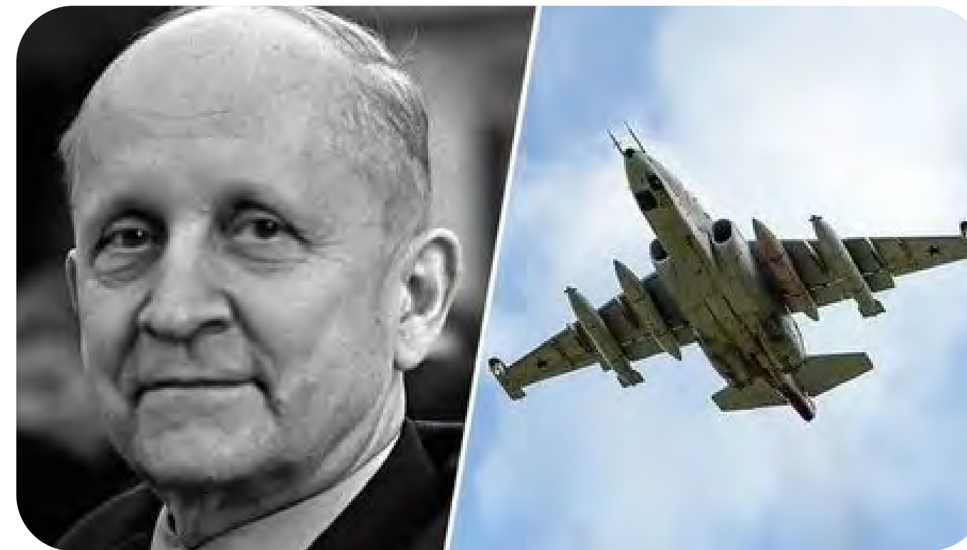
Павел Осипович Сухой — советский авиаконструктор, доктор технических наук, один из основателей советской реактивной и сверхзвуковой авиации