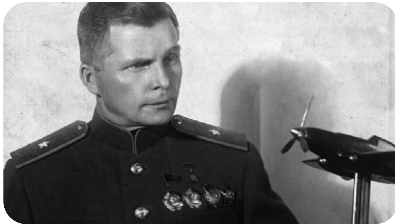
Сергей Владимирович Ильюшин — советский авиаконструктор, разработчик самого массового боевого самолёта в истории — штурмовика Ил-2