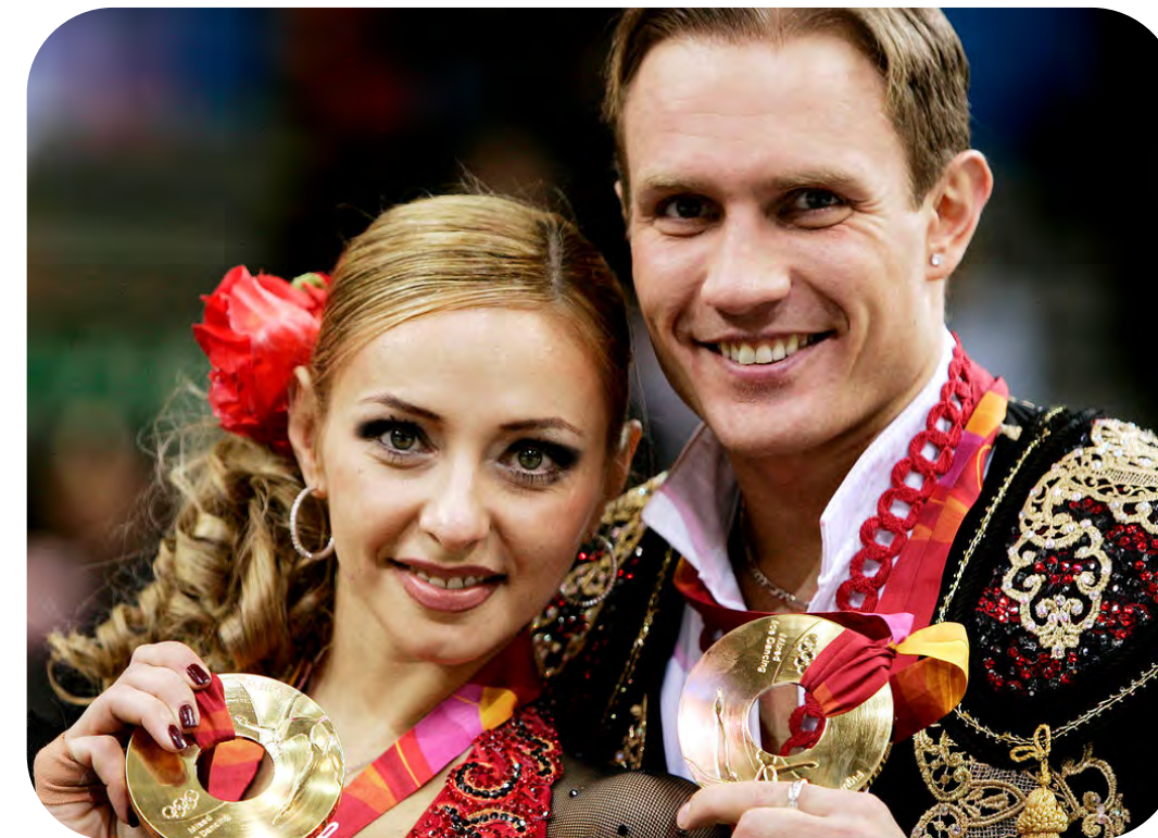
Татьяна Навка и Роман Костомаров