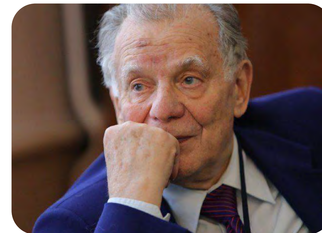
Жорес Иванович Алфёров — физик полупроводников, академик АН СССР, академик РАН, лауреат Нобелевской премии по физике (2000)